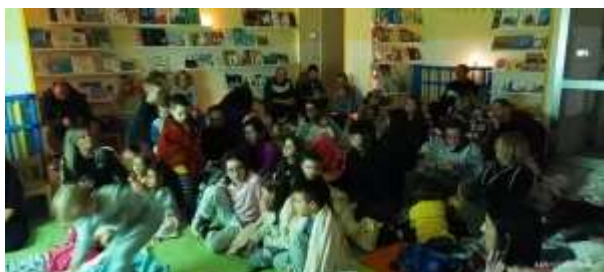
Maschere in arte